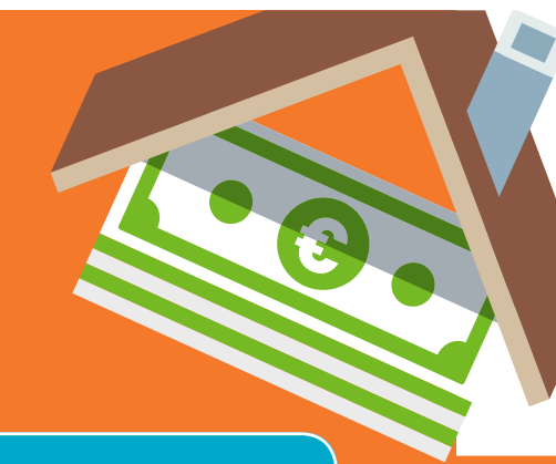
TABLEAU DES PRIMES

Montants des primes (selon la catégorie de revenus du ménage) actualisés au 1er mars 2018 et applicables à toute demande réceptionnée à partir de cette date